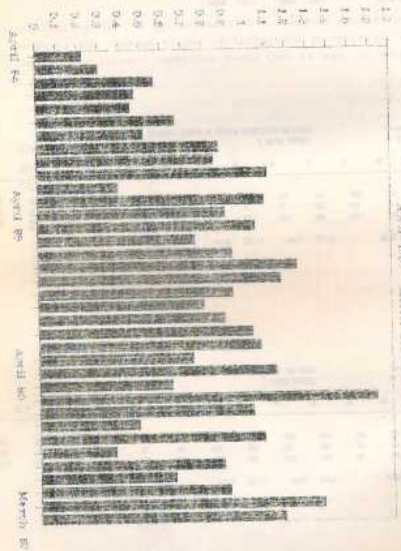
Total Bottles Shipped to Laboratories